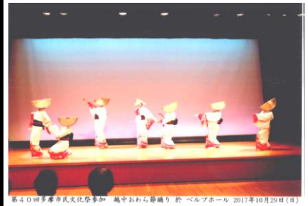
第40回多摩市民文化祭参加 越中おわら節踊り 於 ペルズホール 2017年10月29日(日)